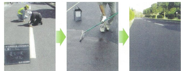
事前準備 (清掃及びカパリング) → Uコート塗布 (レーキ等で簡単に塗布可能) → Uコート仕上がり (養生中) (注意:クラックが発生している箇所については、当社製品クイックバーの併用をお勧めします。)