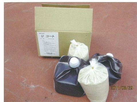
Uコートの荷姿 Uコートバインダー/10kg(5kg×2袋) 珪砂/10kg(5kg×2袋) 合計/20kg(段ボール箱入り)